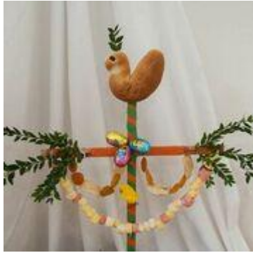
3.11 Witte Donderdag: Het brood