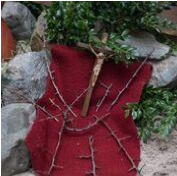
3.13 Pasen: Tijd om op te staan