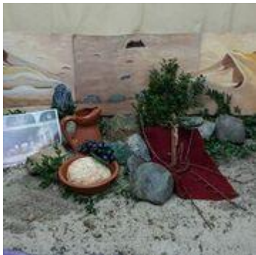
3.12 Goede Vrijdag: Het gebroken brood